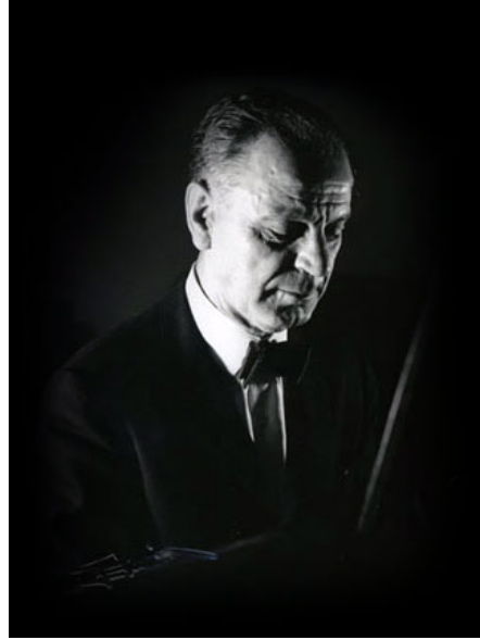
Resim 1.3 Ulvi Cemal Erkin