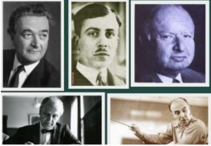
Resim 1.1: Türk Beşleri (sol üstten alta doğru A.A. Saygun, H.F. Alnar, N.K. Akses, U.C. Erkin, C.R. Rey)

Cumhuriyet'in 1923 yılında kurulmasından sonra, ulusalcı kültür ve eğitim politikalarının sonucu olarak Türkiye'de çok sesli müzik çalışmaları da hız kazanmıştır. Atatürk'ün direktifiyle 1924 yılından itibaren birçok yetenekli müzisyenimiz, müzik eğitimi görmek üzere Avrupa ülkelerine gönderilmiştir. Türk müziğinin evrensel düzeye ulaşmasını amaçlayan bu hareketin içerisinde yer alan Cemal Reşit Rey, Ulvi Cemal Erkin, Hasan Ferid Alnar, Ahmet Adnan Saygun ve Necil Kazım Akses, Batı Müziği yapısı içinde klasik Türk müziği ve Türk halk müziğinin renklerini kullanmayı amaçlamışlardır. "Türk Müzik İnkılâbı" adıyla yapılan bu değişiklikler Çağdaş Türk Müziği'ni doğurmuştur.