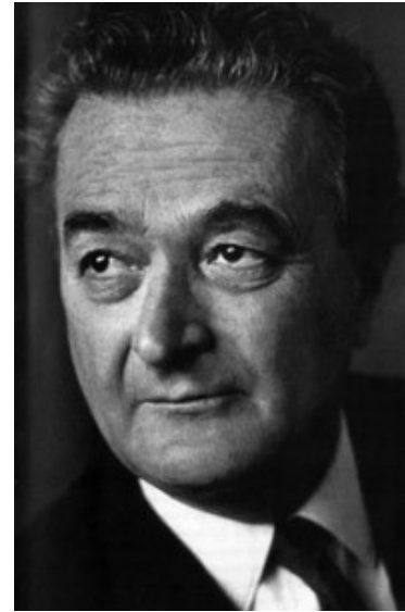
Resim 1.5 Ahmet Adnan Saygun