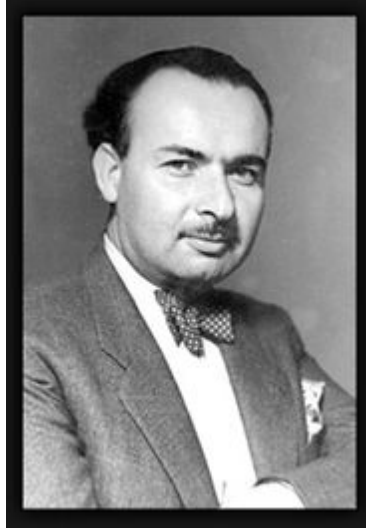
Resim 1.6 Necil Kazım Akses

Necil Kazım Akses, keman dersi almaya yedi yaşında başlamıştır. Ortaöğrenimi sırasında Dârülelhan'da (İstanbul Belediye Konservatuarı) Cemal Reşit Rey'in armoni sınıfına yazılmıştır.